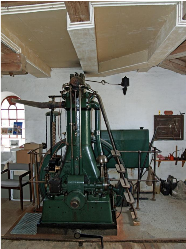
Buch dieselmotoren står i kælderen